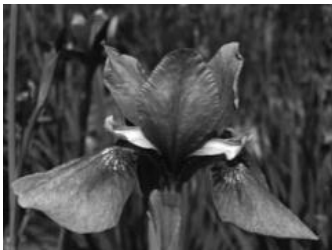
Kosatec sibiřský 'Sea Shadows' Iris sibirica 'Sea Shadows'