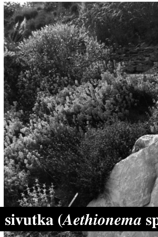
sivutka ( Aethionema sp.)