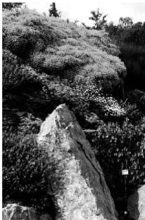
kručinka (Genista lydia)