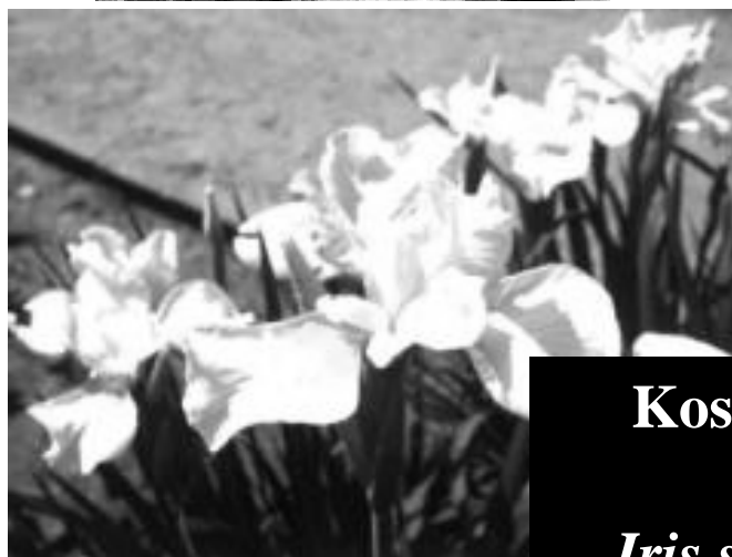
Kosatec sibiřský 'White Swirl' Iris sibirica 'White Swirl'